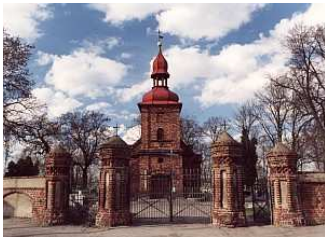
Kościół pw. św. Andrzeja w Przemęcie – stan obecny.