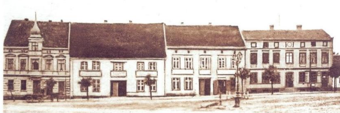
Rynek - Markt

Pozdrowienie z Wielichowa Gruss aus Wielichowo