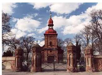
Kościół pw. św. Andrzeja w Przemęcie – stan obecny.